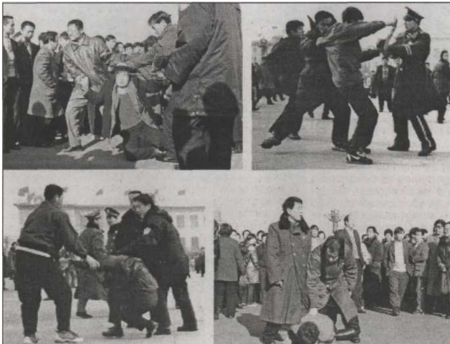
Полицията нанася побой на практикуващи фалун Гонг през 2000 г.

Преследването започва през 1999 г. Бившият китайски комунистически лидер Цзян Цзъмин е инициатор. Около 1997 г. правителството прави проучване и установява, че за всеки практикуващ Фалун Гонг хазната пести по 1000 юана годишно на човек за здравеопазва